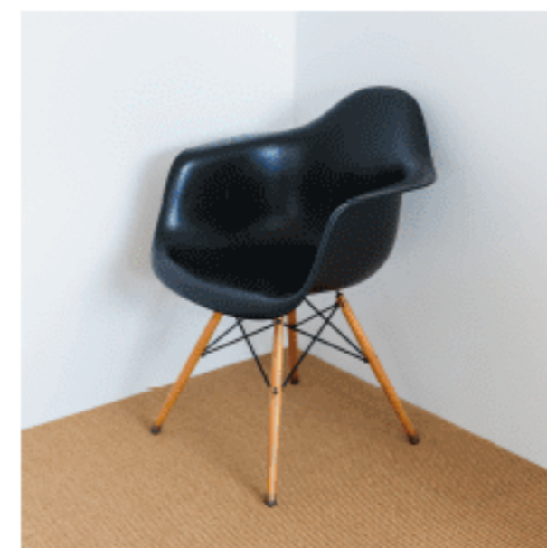
ラウンジチェア 色：ブラック 数量：1