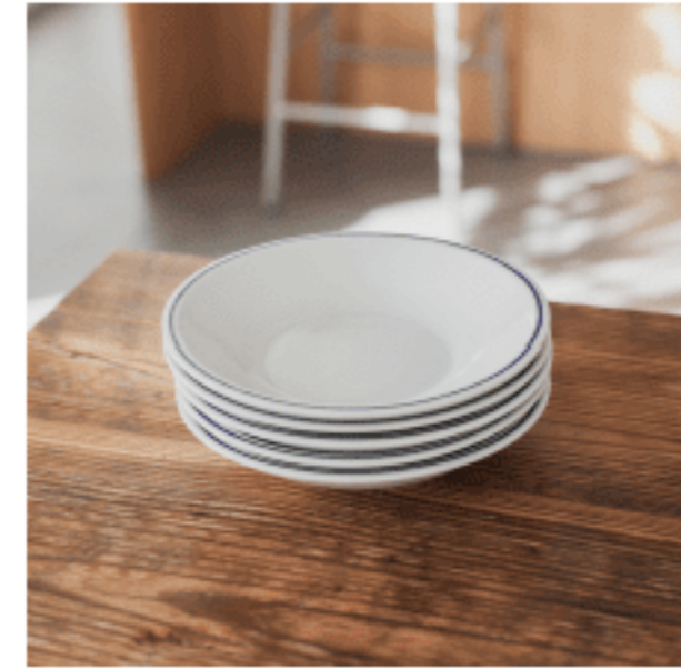
白皿 (パスタボウル・ブルーライン)