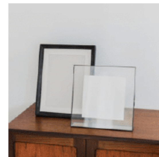
フォトフレーム サイズ：【左】38、30、2【右】30、30、7 数量：各1