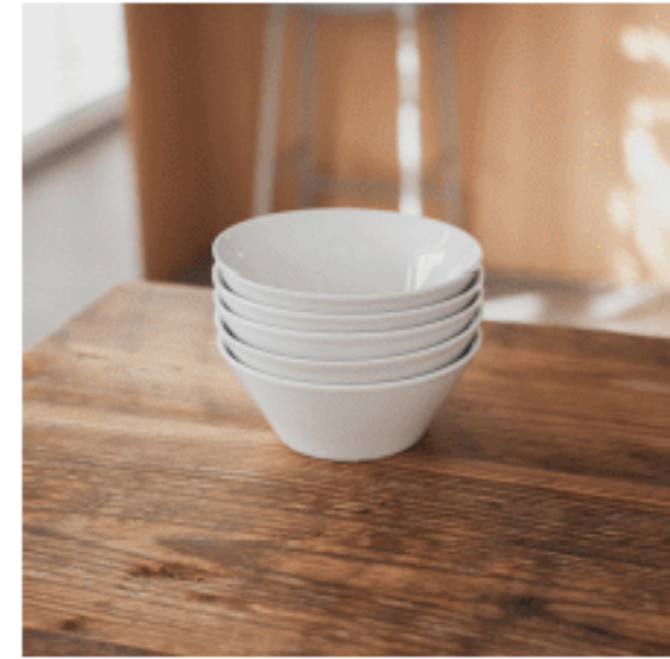
白皿 (サラダボウル)