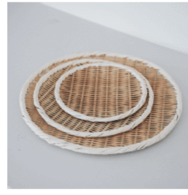
盆ざる サイズ：【大】33【中】24【小】21 数量：各1