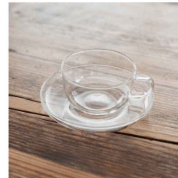
ティーカップ・ソーサー (耐熱)