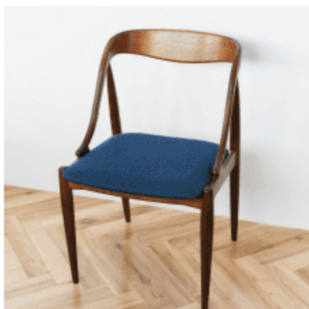
ロースツール 色：ネイビー 数量：2