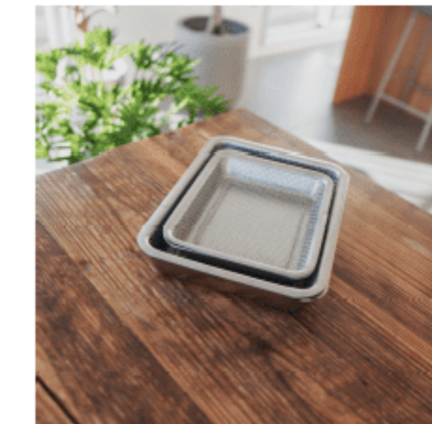
バット 色：クリア サイズ：【大】4.5、20.5、26.5 【小】3、17、21 数量：大2、小1