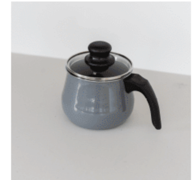
ポット 色：プラチナム サイズ：17（ふた込み）、15.65、15.65 数量：1