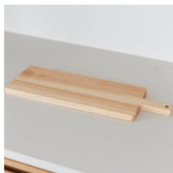
カッティングボード 色：ページュ サイズ：1.8、43(持ち手含む)、15 数量：