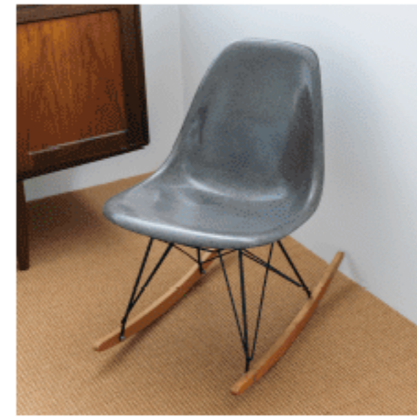
ロースツール 色：グレー 数量：1