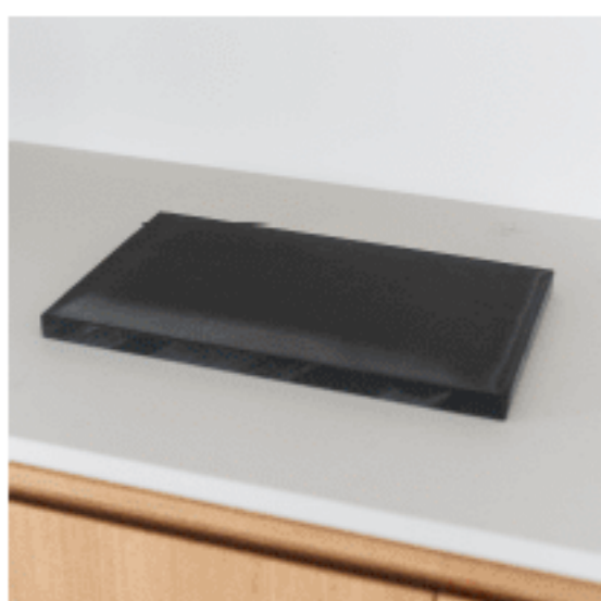
まな板 色：ブラック サイズ：2、40、25 数量：1