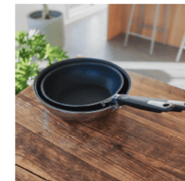
フライパン (28cm、27cm) 色：ブラック サイズ：【大】5.3、28、28 【小】27、27 数量：各1