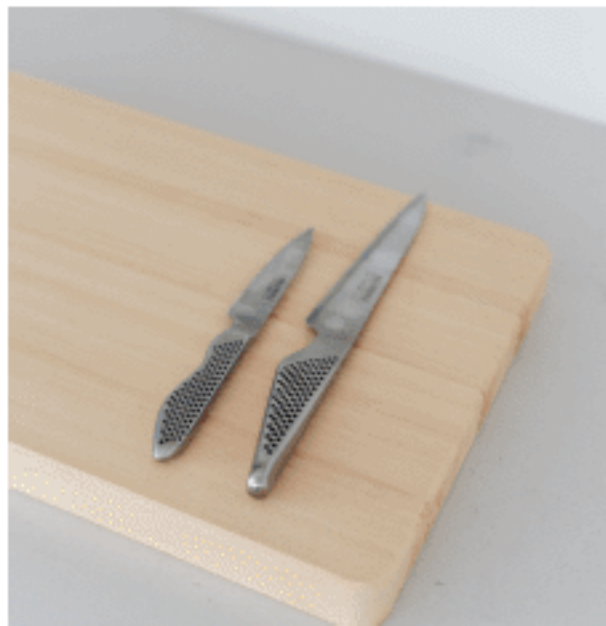
皮むき包丁・フレキシブルナイフ 色：シルバー サイズ：【左】全長19、刃渡り9 【右】全長27、刃渡り15 数量：各1