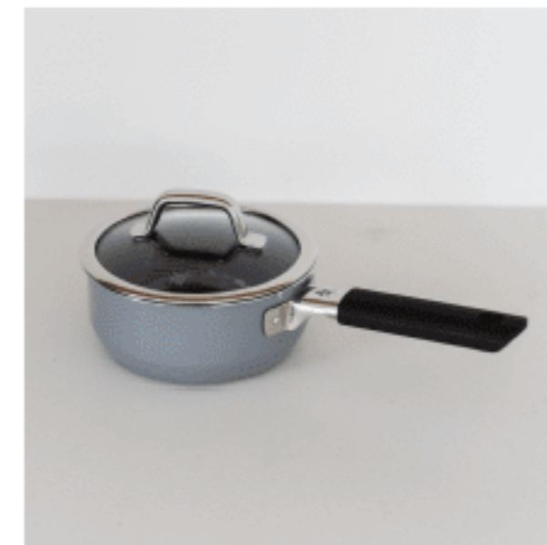
ソースパン 色：プラチナム サイズ：13（ふた込み）、17.5、17.5 数量：1