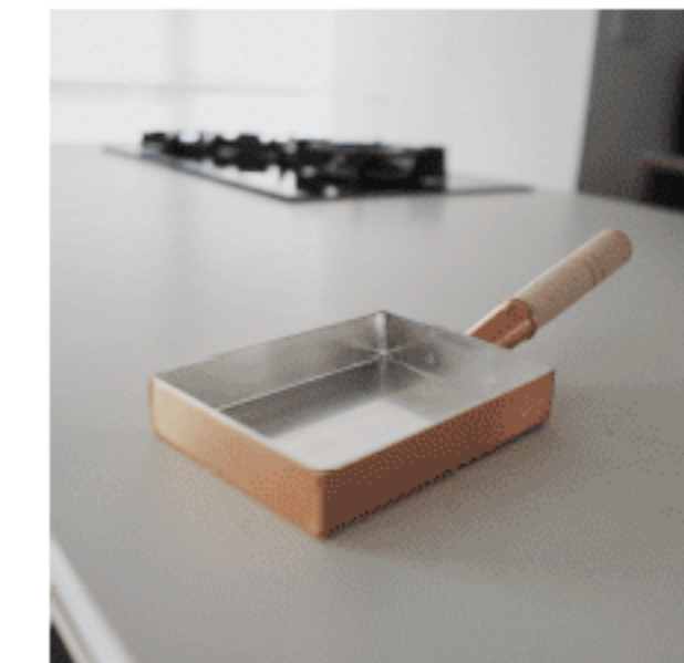
卵焼き器 色：赤銅色 サイズ：3、12、34.5 数量：1、