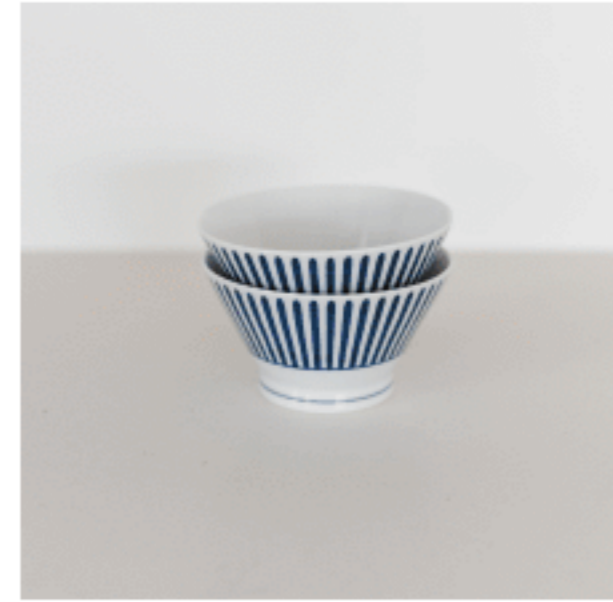
茶碗 (十草) 色：ブルー サイズ：6.5、11.3、11.3 数量：2