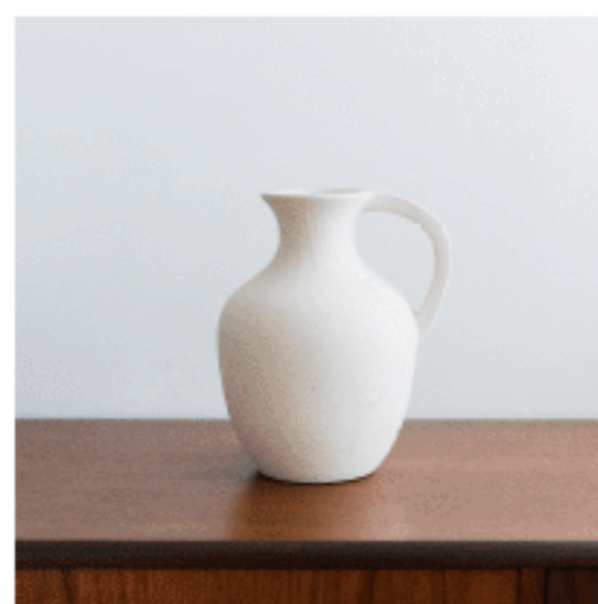
セラミックフラワーベース 色：アイボリー サイズ：25、21、18 数量：1