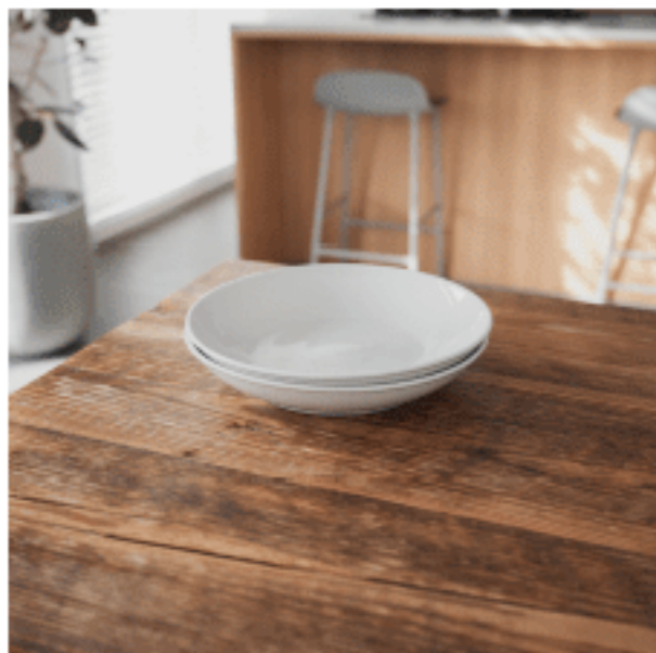
白皿 (ラウンドディッシュ)