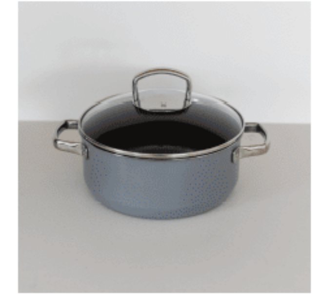
鍋 色：プラチナム サイズ：20（ふた込み）、25.5、25.5 数量：1