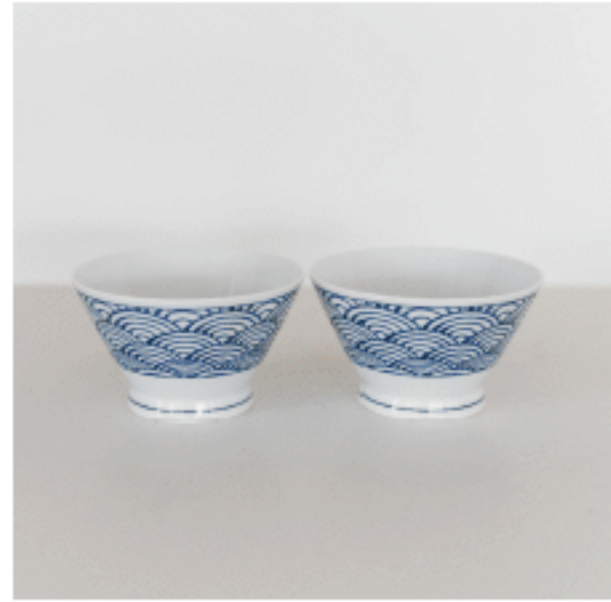
茶碗 (青海波) 色：ブルー サイズ：7.5、12.5、12.5 数量：2