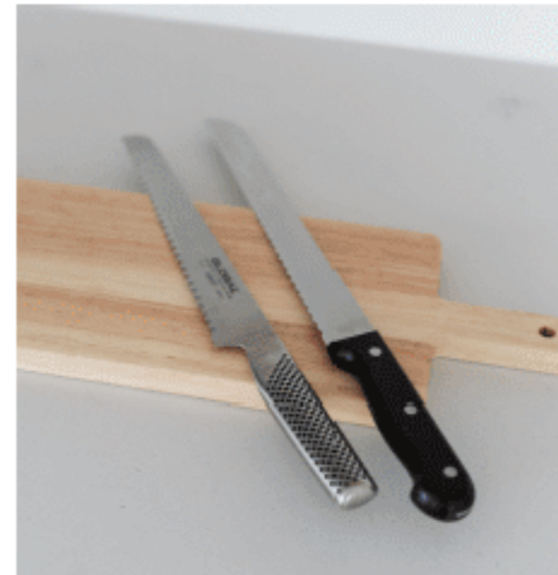
ブレッドナイフ 色：シルバー/ブラック サイズ：【左】全長34.3、刃渡り22 【右】全長38、刃渡り25 数量：各1