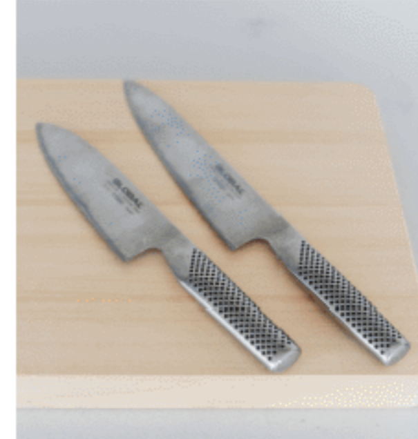
三徳包丁・牛刀 色：シルバー サイズ：【左】全長28.3、刃渡り16.5 【右】全長34.5、刃渡り20.5 数量：各1