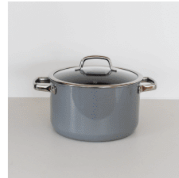
鍋 色：プラチナム サイズ：15（ふた込み）、25.5、25.5 数量：1