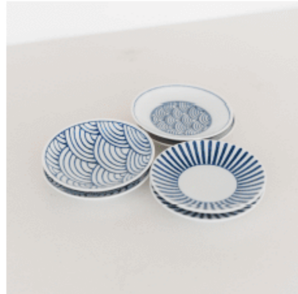
豆皿 (青海波、十草) 色：ブルー サイズ：2、10、10 数量：各2