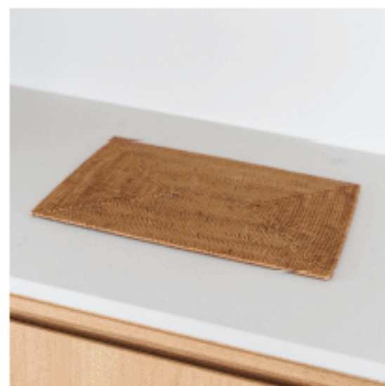
ランチョンマット (角形) 色：ラタン サイズ：0.5、40、30 数量：2