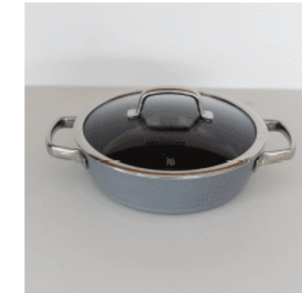
ロースター 色：プラチナム サイズ：15.5（ふた込み）、25、25 数量：1