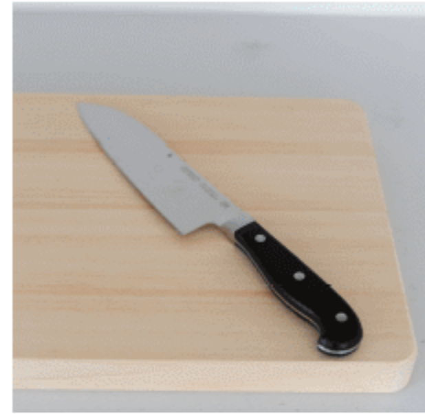
三徳包丁 色：ブラック サイズ：【全長】32.5【刃渡り】18 数量：1