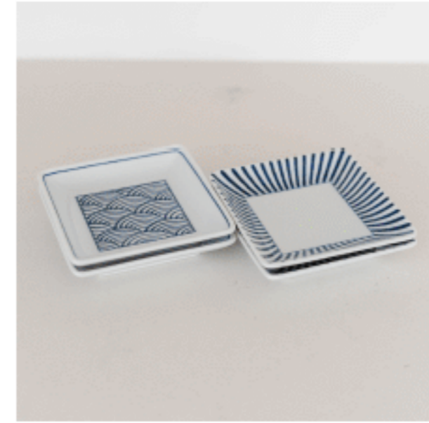
角皿 (青海波、十草) 色：ブルー サイズ：2.4、12、12 数量：各2