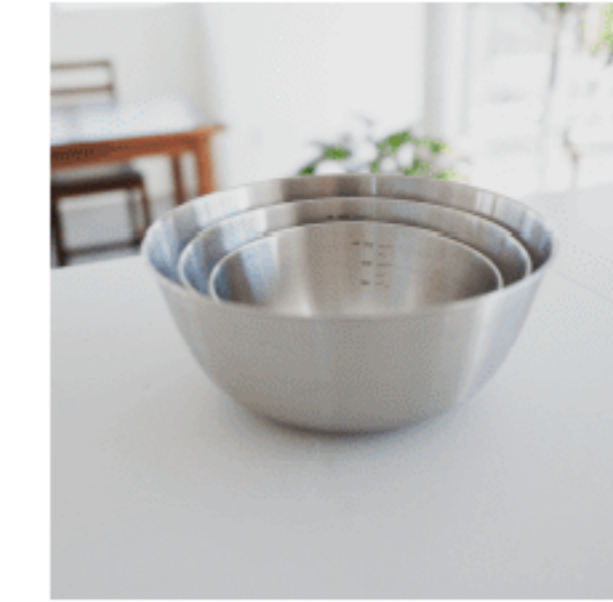
ステンレスボウル (ざる付き) 色：シルバー サイズ：【大】9.5、22、22 【中】8、19、19 【小】6.5、16、16 数量：各1