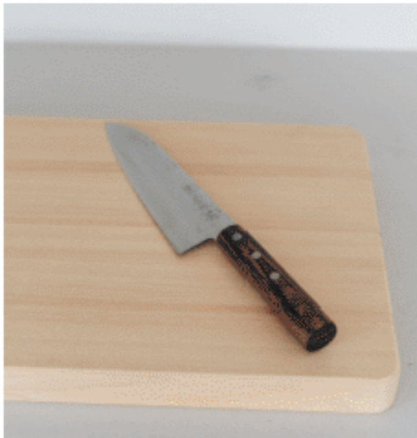
三徳包丁 色：ブラウン サイズ：【全長】30.5【刃渡り】18 数量：1