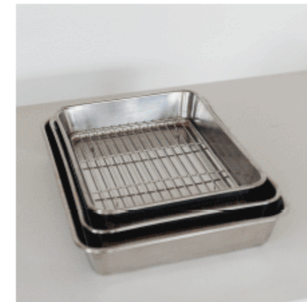
バット 色：シルバー サイズ：【10枚取】6.5、27、35.5 【12枚取】5.3、26、32.5 【15枚取】5.0、23.2、29.7 数量：各1