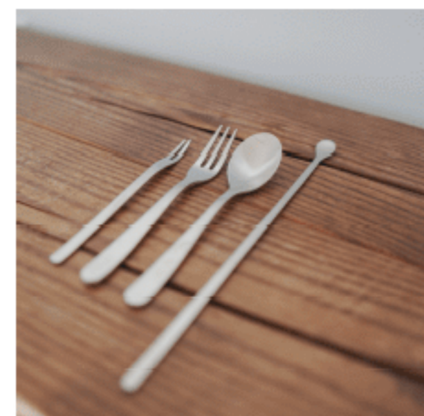
カトラリー 色：シルバー 数量：【ヒメフォーク】5 【ティーフォーク】5 【ティースプーン】5 【マドラー】1