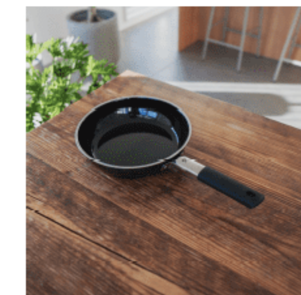
フライパン (24cm) 色：ブラック サイズ：5.8、25.5、25.5 数量：1