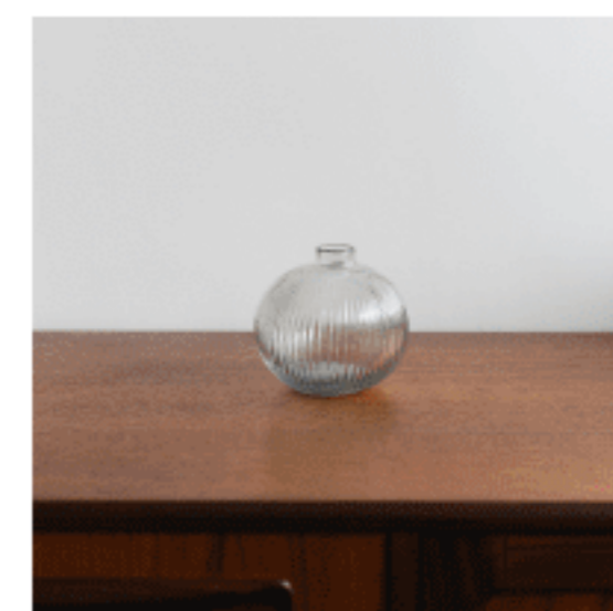
ガラスフラワーベース 色：クリア サイズ：13、13、13 数量：1