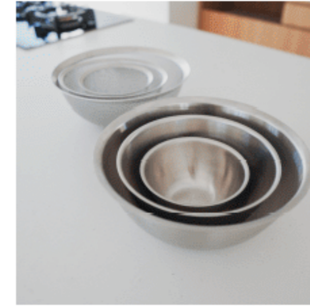
ステンレスボウル (ざる付き) 色：シルバー サイズ：【大】11.5、29.3、29.3 【中】10.3、22.4、22.4 【小】7.2、15.9、15.9 数量：各1