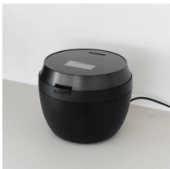
炊飯器 色：ブラック 数量：1