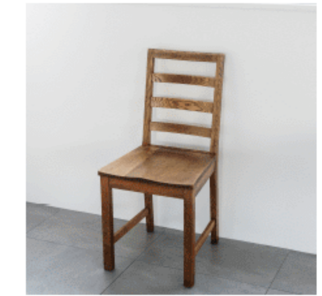
スツール 色：ライトブラウン 数量：1