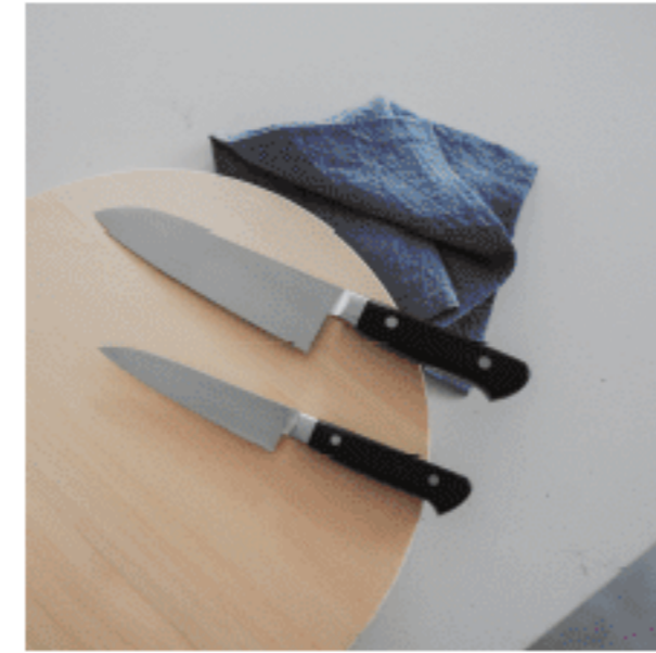
三徳包丁・ペティナイフ 色：ブラック サイズ：【左】全長23、刃渡り12.5 【右】全長30、刃渡り17.5 数量：1