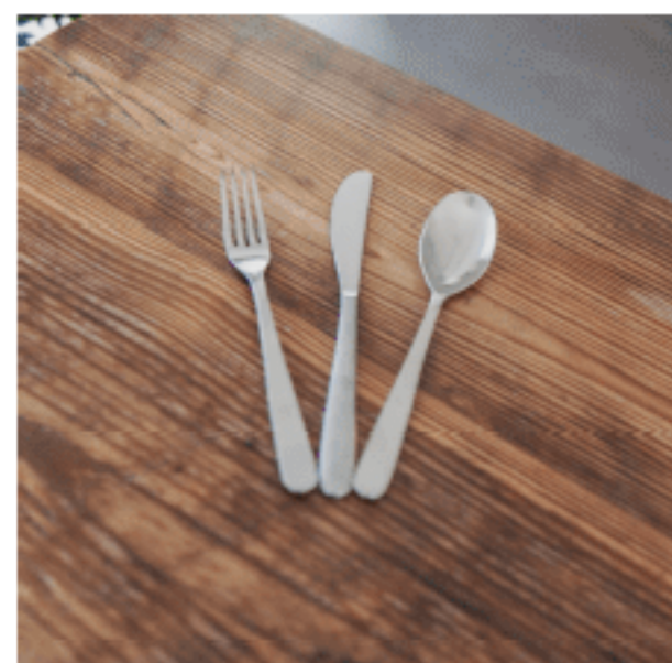
フォーク・ナイフ・スプーン 色：シルバー 数量：各4