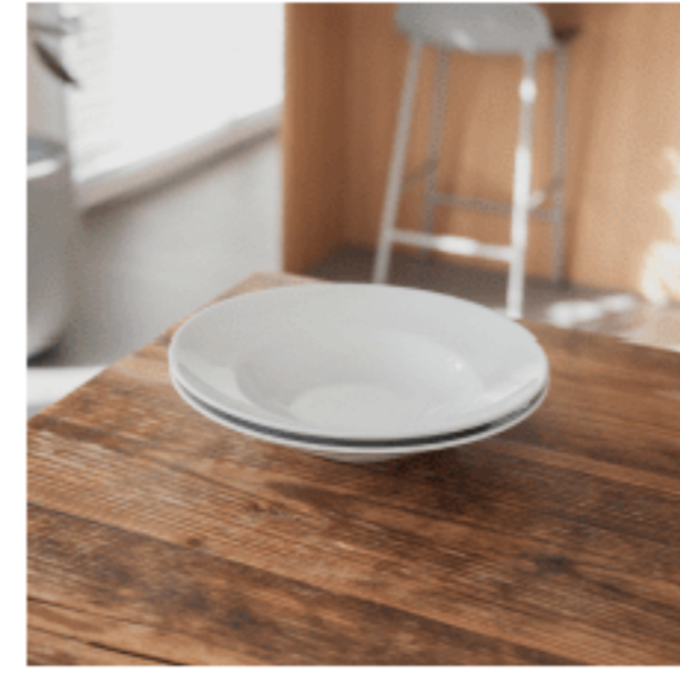
白皿 (パスタボウル)