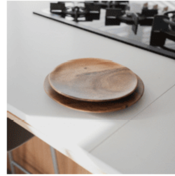
アカシアプレート