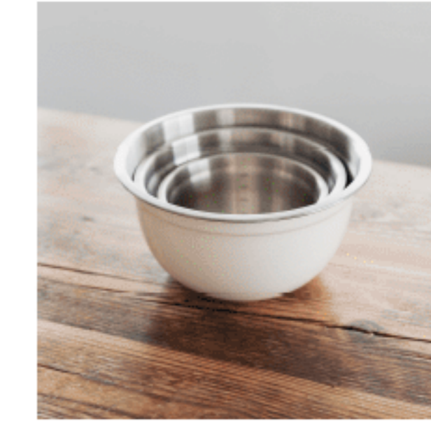
ミキシングボウル 色：クリーム サイズ：【3L】9.5、17.7、17.7 【2L】11.5、21.7、21.7 【1L】13、26、26 数量：各1