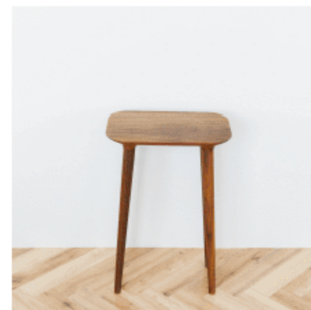
ハイスツール 色：ブラウン 数量：1