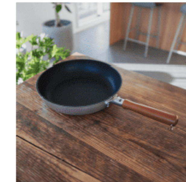
フライパン (30cm) 色：ブラック/ブラウン サイズ：11.4、30、30 数量：1