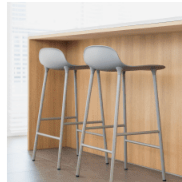
ハイスツール 色：ライトグレー 数量：2