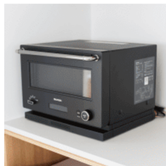
オーブンレンジ 色：ブラック 数量：1