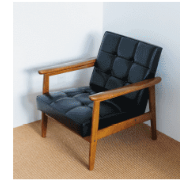
ラウンジチェア 色：ブラック 数量：3