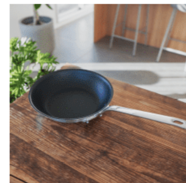
フライパン (29cm) 色：シルバー サイズ：29、29 数量：1