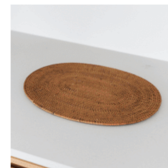
ランチョンマット (オーバル) 色：ラタン サイズ：0.5、40、30 数量：2