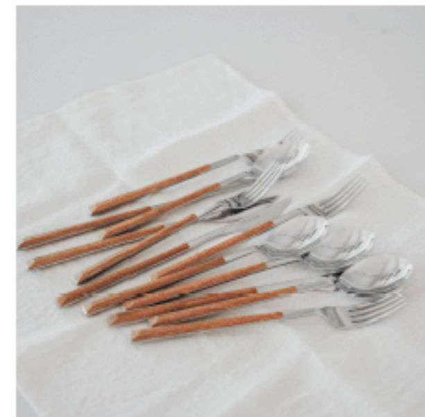
フォーク・ナイフ・スプーン 色：ウッド 数量：各4