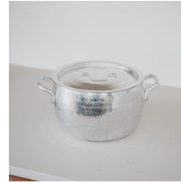
半寸胴鍋 色：シルバー サイズ：14、21、21 数量：1