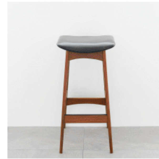
ハイスツール 色：ブラック 数量：1