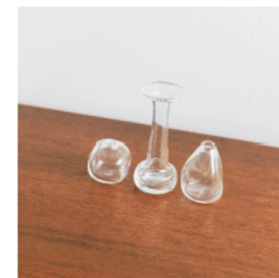
フラワーベース各種