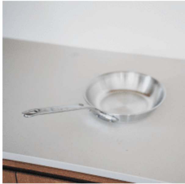
フライパン (21cm) 色：シルバー サイズ：21、21 数量：1