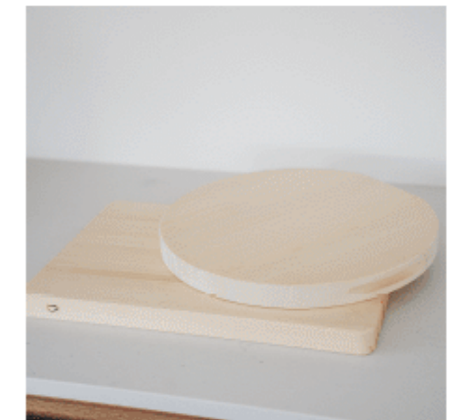
まな板 色：ベージュ サイズ：【上】3、35、35 【下】3、42、28 数量：各1